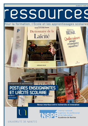
Postures enseignantes et laïcité scolaire Mars 2021