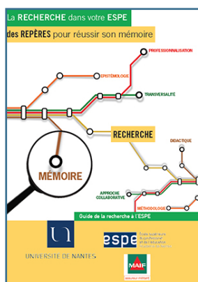
La recherche dans votre ESPE, des repères pour réussir son mémoire

Dans un format court et accessible, les livrets «Repères» exposent des connaissances et des réflexions sur des questions vives de la formation des enseignants. Les contributions de différents acteurs proposent trois types d'apports pour aider à se situer dans la formation : des repères sur les enjeux, des repères pour comprendre, des repères pour agir.