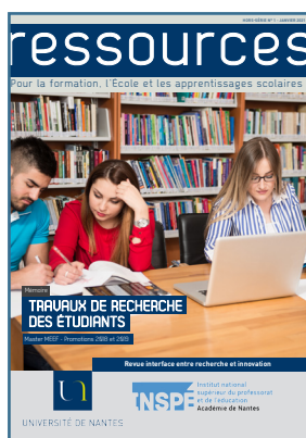
Travaux de recherche des étudiants de l'Inspé Janvier 2021