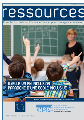
Il/elle va en inclusion paradoxe d'une école inclusive Juin 2020

Cette revue interface entre recherche et innovation veut donner accès à la diversité d'approches scientifiques des recherches, des expérimentations menées en Inspé. Elle souhaite permettre aux chercheurs, formateurs, professionnels et étudiants de publier leurs travaux de recherche, d'innovation ou d'expérimentation.